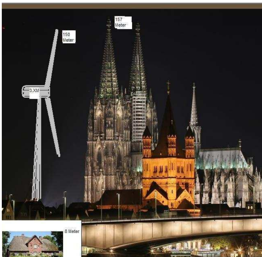
Größenvergleich: Reethaus, 150-Meter-Kraftwerk, Kölner Dom

Entsteht vor unserer Haustür der größte und höchste Windpark Schleswig-Holsteins?